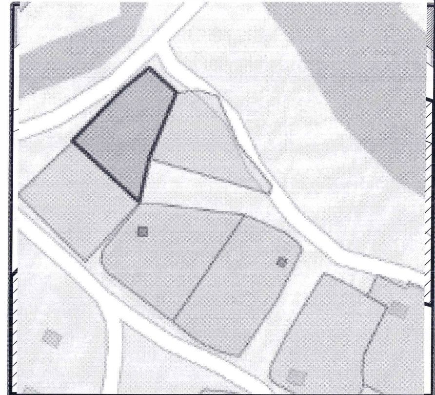
Чертёж градостроительного плана земельного участка разработан на основе сведений ИСОГД МО "Усть-Коксинский район"