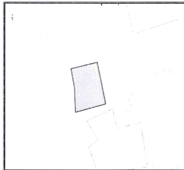
Чертёж градостроительного плана земельного участка разработан на основе сведений ИСОГД МО "Усть-Коксинский район"